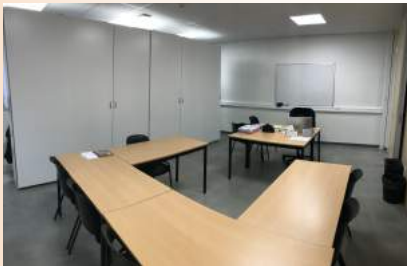
, Des salles agréables pour les cours théoriques