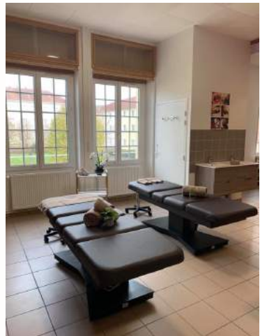
Des salles de pratique équipées de mobilier professionnel et neuf